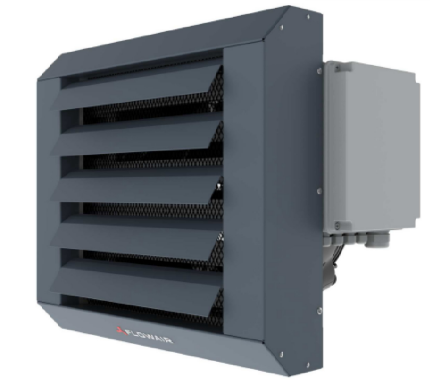
NAGRZEWNICA ELEKTRYCZNA NP. TYP LEO EL S BM F-MY FLOWAIR