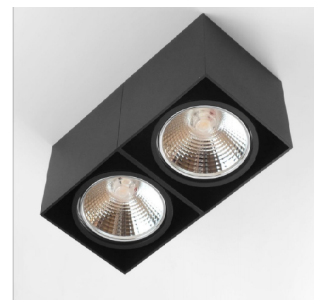
OŚWIETLENIE: PODWÓJNA OPRAWA NATYNKOWA, Z REGULACJĄ KĄTA ŚWIECENIA W DWÓCH PŁASZCZYZNACH